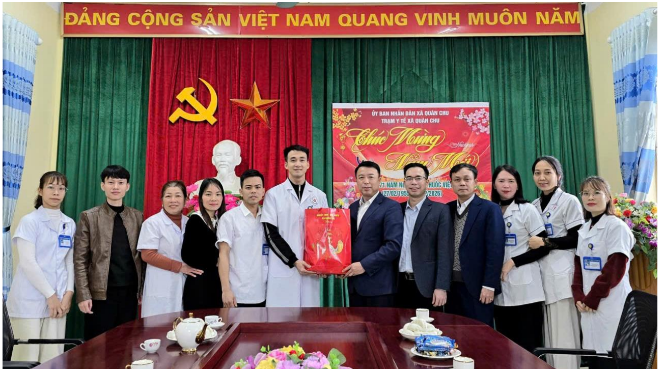
Các đồng chí lãnh đạo xã Quân Chu đến thăm hỏi, động viên cán bộ, nhân viên Trạm Y tế xã Quân Chu